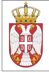
Slika 1: Grb